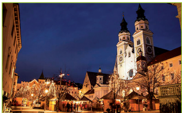
Weihnachtsmärkte Mercatini di Natale