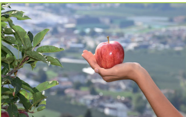
Apfelfest in Natz im Oktober Festa della mela a Naz in ottobre