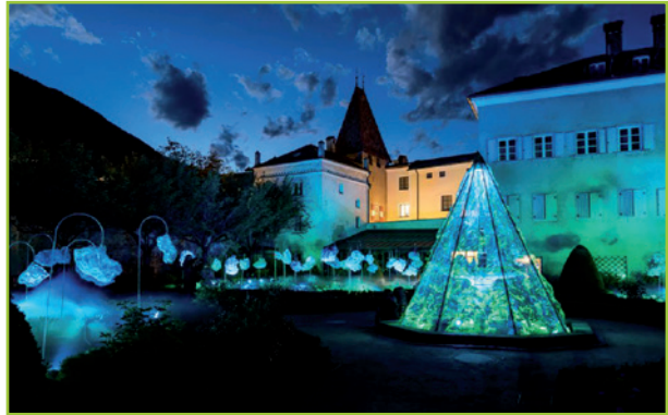
Wasser Licht Festival in Brixen im Mai Festival di acqua e luce a Bressanone