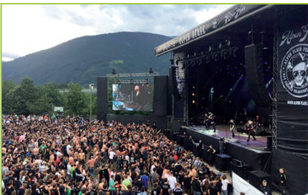
Alpenflair Festival in Natz im Juni Festival "Alpenflair" a Naz in giugno