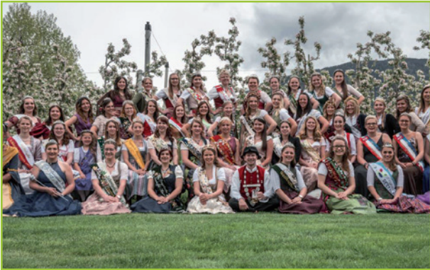
Königliches Festival in Natz am 1. Mai Festival Reale a Naz il 1 maggio