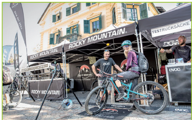
Mountainbike Festival im September Mountainbike Festival a Bressanone